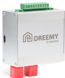
Chytré zařízení Dreemy

„Zařízení Dreemy vychází z aktuálních a predikovaných hodnot, na jejichž základě směřuje vyrobenou energii do spotřeby domácnosti a její případné přebytky do sítě nebo jednoho z úložišť v systému. Tato regulace má však i některé další zajímavé funkce: dokáže například výhodně obchodovat na spotových trzích nebo monitorovat anomálie v systému: dají se tak zjistit neobvyklé přetoky do sítě či nestandardní chování jednotlivých zařízení a spotřebičů,“ dodává Jiří Šizling, jednatel společnosti Středník a vývojář zařízení Infigy.