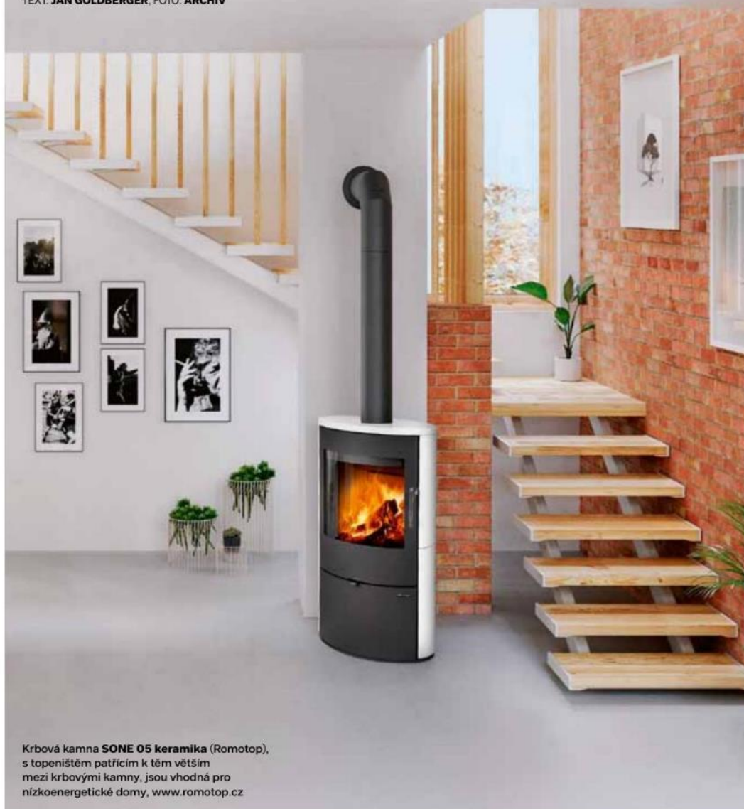
Krbová kamna SONE 05 keramika (Romotop), s topeništěm patřícím k těm větším mezi krbovými kamny, jsou vhodná pro nízkoenergetické domy, www.romotop.cz