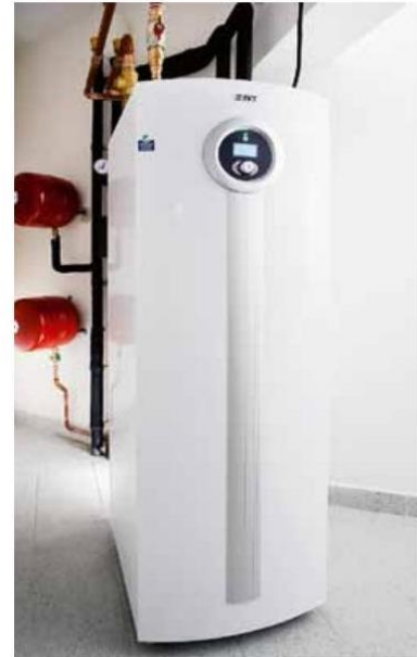
IVT PremiumLine EQ je osvědčené tepelné čerpadlo země/voda s topným faktorem COP 5,1 a se stabilním výkonem při minimálním poklesu výkonu v zimním období (IVT)

Pro charakteristiku celoročního provozu se pak nejnepříjemněji používají údaje SCOP – sezónní topný faktor – a SEER – údaje o průměrné roční sezónní účinnosti. Jde o výpočet z celoroční produkce tepla a tepelné ztráty v topné sezóně při standardizovaných provozních a klimatických podmínkách. Ve výpočtu jsou tedy zahrnuty změny podmínek v průběhu celého roku. Podle evropské směrnice ovšem mohou výrobci uvádět dosažené hodnoty v rozpětí od -2 °C do -10 °C. SCOP se tedy může mezi modely o stejném příkonu lišit podle toho, jakou hodnotu pro měření výrobce zvolil. Prodejce by měl být tedy schopen poskytnout informaci o garantované teplotě vody a při jaké venkovní teplotě měření proběhlo. Obvykle se jedná o teploty 0 °C, -5 °C nebo -10 °C. Některé společnosti například uvádějí přímo v katalogu grafy průběhu účinnosti v různých podmínkách až do -15 °C při zahrnutí všech ostatních faktorů, které na účinnost mají vliv – například ventilátory, oběhové čerpadlo nebo odtávání.