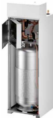
Pohled do otevřené vnitřní jednotky tepelného čerpadla Panasonic Aquarea EcoFlex (PANASONIC)

Tepelná čerpadla vzduch/voda mají také teplotní limity. Nejsou vhodná do prostředí, kde teploty vzduchu klesají pod -18^{\circ}\text{C} , protože se jim výrazně snižuje výkon a roste spotřeba elektriny. I v těchto případech jsou mnohem vhodnější čerpadla země/voda. V tomto smyslu si dejte pozor na bod bivalence, který hraje při výpočtech parametrů COP a SCOP zásadní roli. Jde o teplotu, při níž tepelné čerpadlo potřebuje pomocný, tedy bivalentní, zdroj tepla – např. elektrickou spirálu, která je jeho součástí.