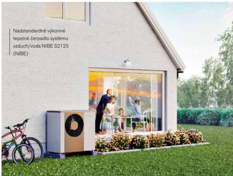
Nadstandardně výkonné tepelné čerpadlo systému vzduch/voda NIBE S2125 (NIBE)