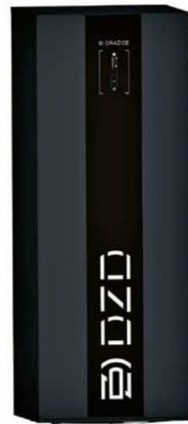
Revoluční hybridní solární úložisko Slunečnice (model S3), které v sobě kombinuje zásobník teplé vody a bateriové úložisko (DZ DRAŽICE)