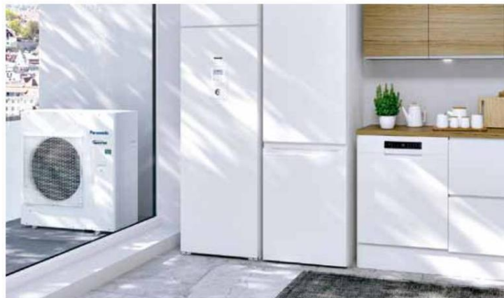
Vnitřní a vnější jednotka tepelného čerpadla Panasonic Aquarea EcoFlex (PANASONIC)