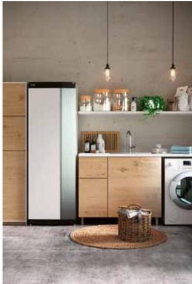
NIBE S1255 je inteligentní tepelné čerpadlo s řízeným výkonem kompresoru s mimořádně vysokou účinností SCOP až 5,5 (NIBE)

údajů i podrobnějších údajů (např. obytná plocha v m 3 , plocha oken, použitý materiál, obvodové zdivo, izolace).