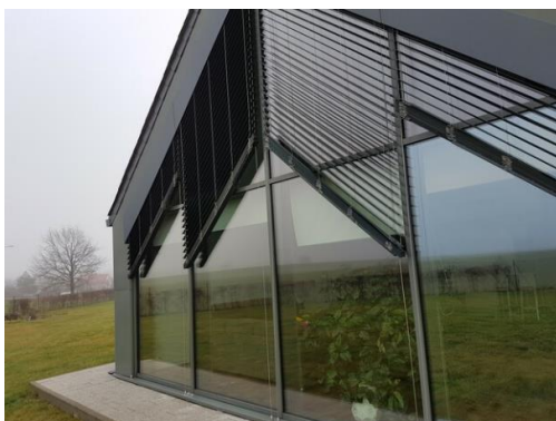
Venkovní žaluzie Cetta 80 Flexi v šikmém provedení. Pohyb v hliníkových vodicích lištách zvyšuje stabilitu a bezpečí. isotra.cz