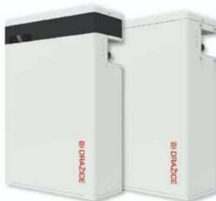
Bateriový systém Trinity B58 z nové divize DZD Solar jako příprava na instalaci střešní fotovoltaické elektrárny. DZ Dražice

Připojení k síti ovšem není jediným kritériem, podle kterého byste měli vybírat solární panely. Podle typu solárních článků lze fotovoltaické panely a kolektory rozdělit na tři typy, které se liší svými vlastnostmi, výkonem a schopností proměňovat