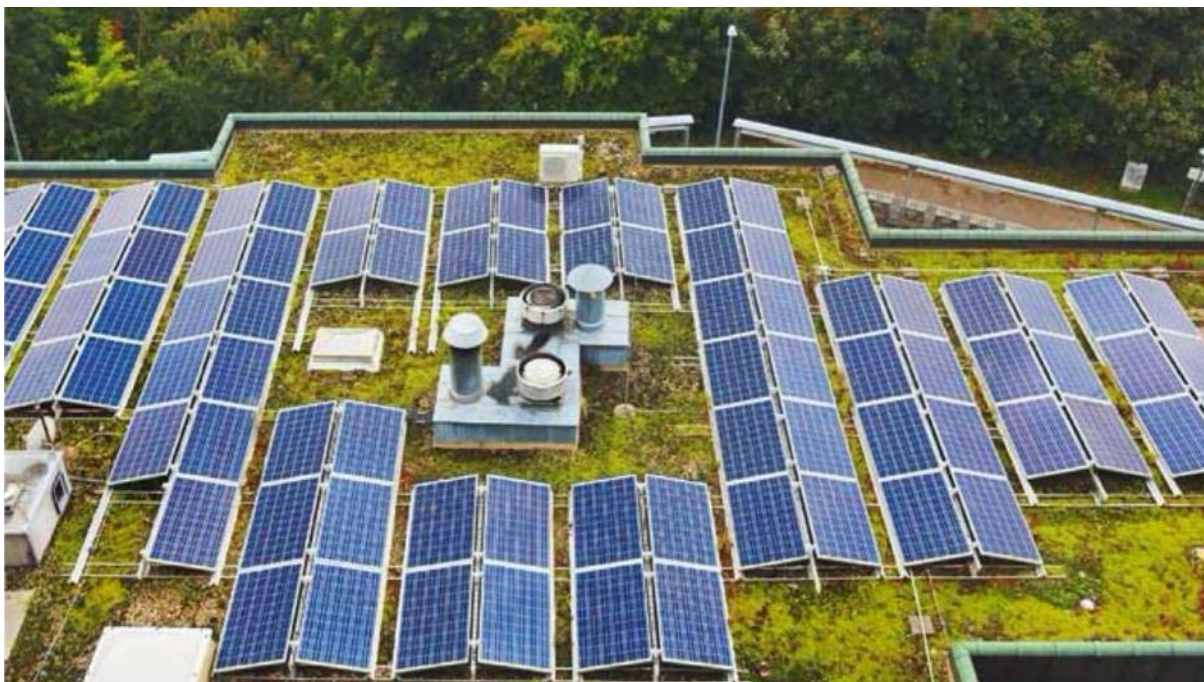
Biosolární plochá střecha: Díky vegetaci odpadá nutnost instalovat přítižení pro fotovoltaické panely, kombinace zeleně a fotovoltaiky snižuje odtok vody ze střechy. GreenTop