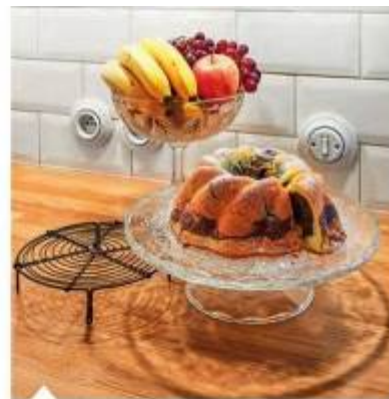
KOMBINACE STARÉHO S NOVÝM Ráda jsem využila staré dózy a nádoby po babičce a doplnila je novými kusky v podobném stylu.

K dyž jsme se rozhodli, že na naší chalupě vybudujeme nové zázemí, stará malinká kuchyň musela ustoupit nové vznikající koupelně (která vyšla v srpnovém vydání NPB) a kuchyň se tak přestěhovala do pokoje, kterému familiárně říkáme „babičkárna“, protože v ní kdysi měla pokoj moje babička. Časem ale místnost ze všeho nejvíce připomínala sklad. Novou kuchyň jsme původně chtěli udělat ze starých skříní a kredencí, kterých se nám po domě valí tucty, ale já se nechtěla vzdát myčky a dalších spotřebičů, a tak nám došlo, že bez nových skříněk to nepůjde. Jako první se udělal krb s rozvaděčím tepla i do ostatních pokojů a my mezitím →