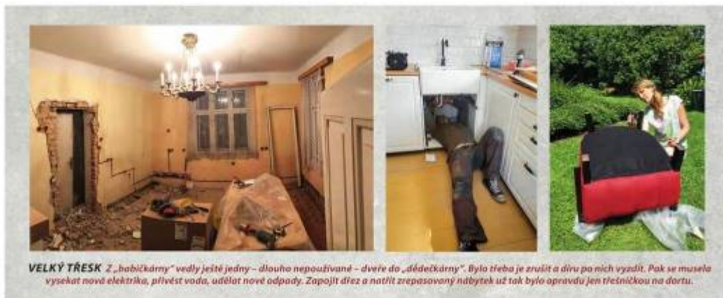
VELKÝ TŘESK Z „babičkárny“ vedly ještě jedny – dlouho nepoužívané – dveře do „dítěčárny“. Bylo třeba je zrušit a díru po nich vyzdívat. Pak se musela vysekat nová elektrika, přivést voda, udělat nové odpady. Zapojit dřež a natít zrepasovaný nábytek už tak bylo opravdu jen třesničkou na dortu.

K dyž jsme se rozhodli, že na naší chalupě vybudujeme nové zázemí, stará malinká kuchyň musela ustoupit nové vznikající koupelně (která vyšla v srpnovém vydání NPB) a kuchyň se tak přestěhovala do pokoje, kterému familiárně říkáme „babičkárna“, protože v ní kdysi měla pokoj moje babička. Časem ale místnost ze všeho nejvíce připomínala sklad. Novou kuchyň jsme původně chtěli udělat ze starých skříní a kredencí, kterých se nám po domě valí tucty, ale já se nechtěla vzdát myčky a dalších spotřebičů, a tak nám došlo, že bez nových skříněk to nepůjde. Jako první se udělal krb s rozvaděčím tepla i do ostatních pokojů a my mezitím →