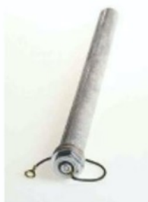
VYMĚNIT PO ČASE Jednou za čas je nutné čistit či vyměnit anodu, která se stále zmenšuje.