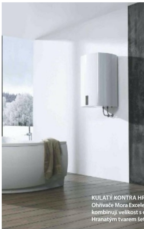
KULATÝ KONTRA HRANATÝ Ohřivače Mora Excelent vhodně kombinují velikost s objemem. Hranatým tvarem šetří i místo.