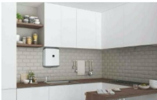
PAN NENÁPADNÝ Takový je plochý ohřívač vody OKHE ONE 20.