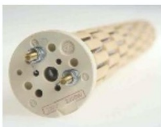
NASUCHO Už 66 let využívají ohřívače z Dražic na vytápění tělesa z keramiky.