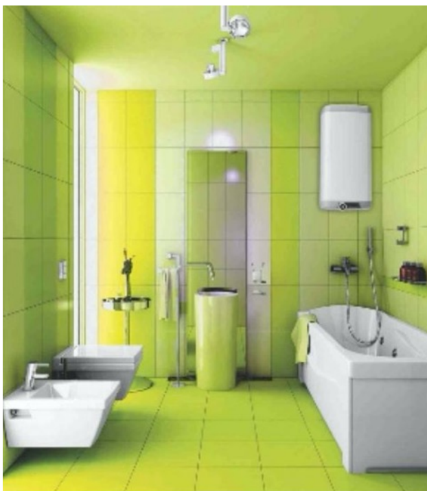
HUBEŇOUR Konceptu dvou nádob vyžívá ohřívač OKHE z Dražic vhodný pro instalaci do menších prostor.