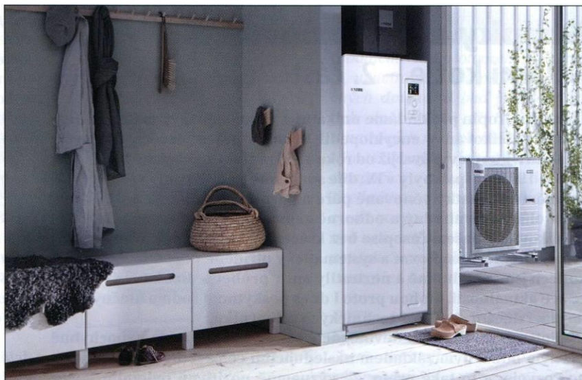
▲ Obr. 3 ● Ideální kombinace splitového systému NIBE s tepelnými čerpadly AMS, hydroboxem HBS a s vnitřní systémovou jednotkou VVM 225. Jednotka se díky spodním vývodům vzadu skvěle hodí do interiéru, a navíc díky nízké výšce ji lze instalovat třeba do prostoru pod schody

Sestava venkovní jednotky AMS 20 kombinuje výhody systému split a elegance kompaktní vnitřní jednotky VVM 225. Díky výkonovým variantám se skvěle hodí jak pro moderní novostavby s nízkou potřebou tepla, tak pro rekonstrukce starších budov. K hlavním výhodám patří především velmi snadná instalace vnitřní jednotky a zcela zásadní výhodou je nízká výška VVM 225. Díky jejím spodním vývodům vzadu je možné ji instalovat například pod schody nebo do sklepních prostor s nízkým stropem.