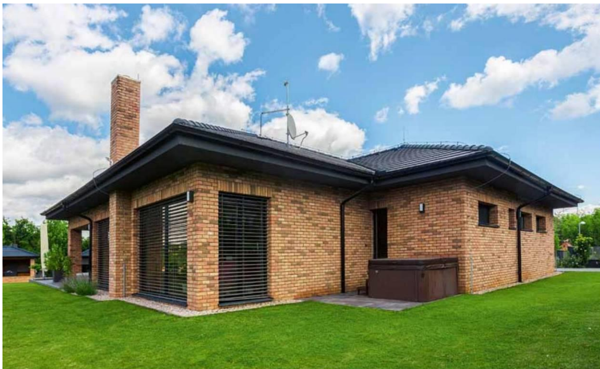
Díky členitému půdorysu a nízké valbové střeše nepůsobí dům ani přes velkou zastavěnou plochu příliš mohutně. Hlavní obývací prostory jsou orientovány na západ, k výhledu dolů ze svahu. Směrem na jih – k sousedům – vede jen jedno rohové okno, aby přivádělo do obývacího pokoje polední slunce. Vede sem také výstup z koupelny k příjemně chráněné vírivce

K lidné místo v západním svahu s dobrou dopravní dostupností má slunnou polohu s krásným výhledem na krajinu s městem a řekou, ideální pro příjemné bydlení. Pozemek o velikosti 3000 m 2 byl donedávna jen zanedbaná louka zanesená odpadem, naše hostitelka jej proměnila v malý kousek ráje. V horní, rovinatější části podél komunikace byl postaven komfortní dům, ve svahu vznikla velká zahrada s bazénem, letní kuchyň a užitkovou částí.