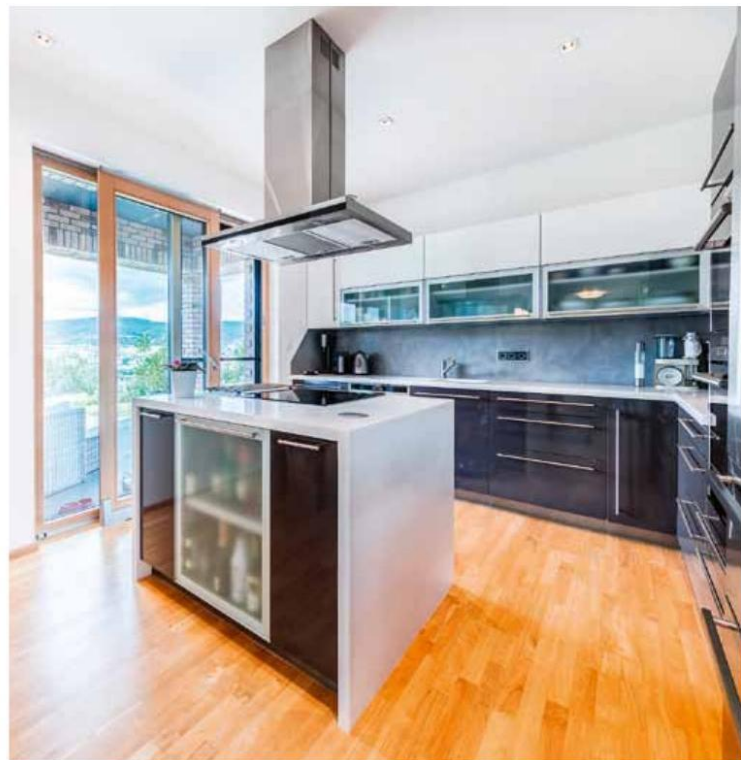
Z kuchyně se dá vyjít přímo na krytou terasu, kde rodina v létě také stoluje. Kuchyňskou linku vyrobilo místní kuchyňské studio na míru z laminovaných MDF desek s příjemným jemně matným povrchem. Je vybavena spotřebiči Siemens a pracovní deskou z odolného kompozitního materiálu Corian