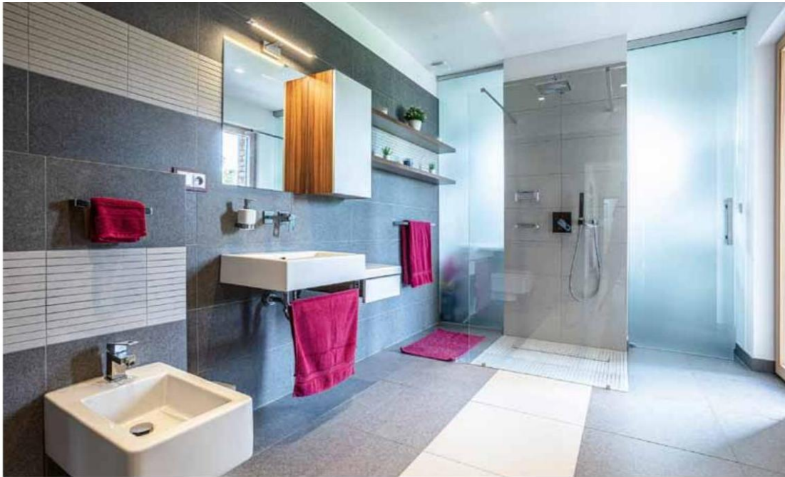
„Provozní“ koupelna: za stěnou se sprchou je místnost pro domácí práce. Je oddělena posuvnými dveřmi z pískovaného skla, které propouštějí světlo