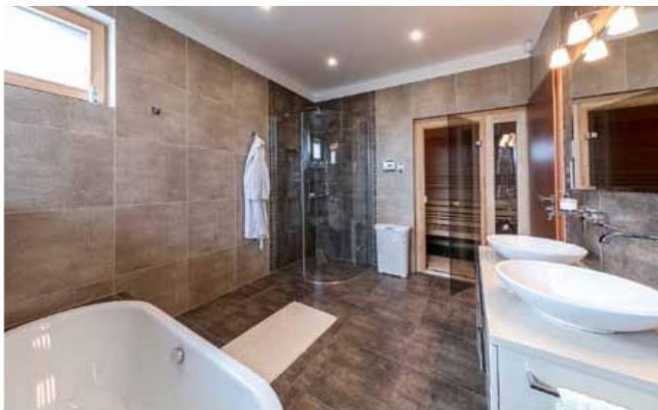
Hlavní koupelna je vybavena sprchovým koutem, saunou, vanou, dvěma umyvadly, bidetem a WC – jsou šikově schované, zavěšené na zídce za zády vany. Obklady koupelen si majitelka sama navrhla (výrobce Dom Ceramiche – Khadi a RAKO)