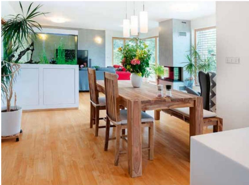
Ve velkém prostoru vyniká jídelní stůl s krásnou kontrastní texturou masivního tropického dřeva. Zapadá do konceptu neutrálních přírodních barev s několika výraznými akcenty. Většina sedacího nábytku pochází z obchodního domu Ikea