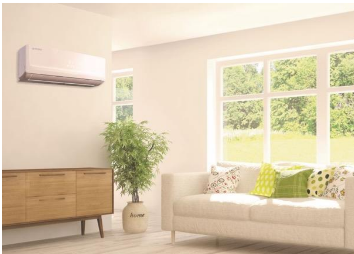
Klimatizace AIR typu split - vnitřní jednotka

Klimatizace AIR26 typu split v interiéru