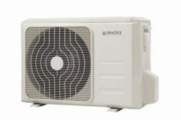
Klimatizace AIR PLUS typu multisplit - 3 vnitřní jednotky