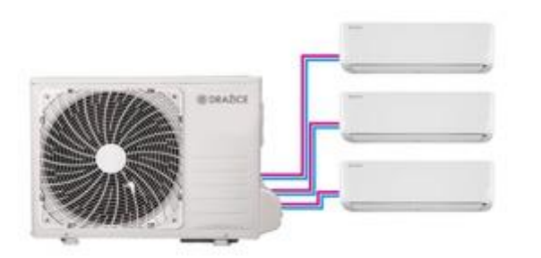
Systém zdravotních filtrů v klimatizaci AIR a AIR PLUS