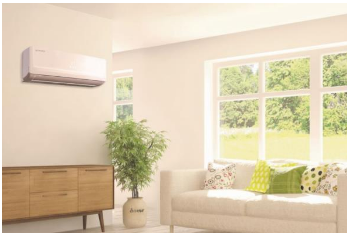
Klimatizace AIR26 typu split v interiéru

V současné době trávíme až 90 % času v uzavřených prostorách svých kanceláří a domovů, a proto bychom se měli ještě více zajímat o kvalitu jejich vnitřního prostředí. Dlouhodobé dýchání přehřátého, vysušeného nebo příliš vlhkého vzduchu plného škodlivin a plísní totiž může ovlivnit naše fyzické i psychické zdraví a vyvolat u nás tzv. syndrom nezdravých budov (SBS – Sick Building Syndrome). Jak tomu lze co nejefektivněji předejít? Můžete samozřejmě pravidelně větrat, a vystavit se tak hluku a nečistotám z venkovního ovzduší, nebo si pořídit automatický systém řízeného větrání. Vzduch ve vaší domácnosti ale dokáže vyčistit i moderní klimatizace.