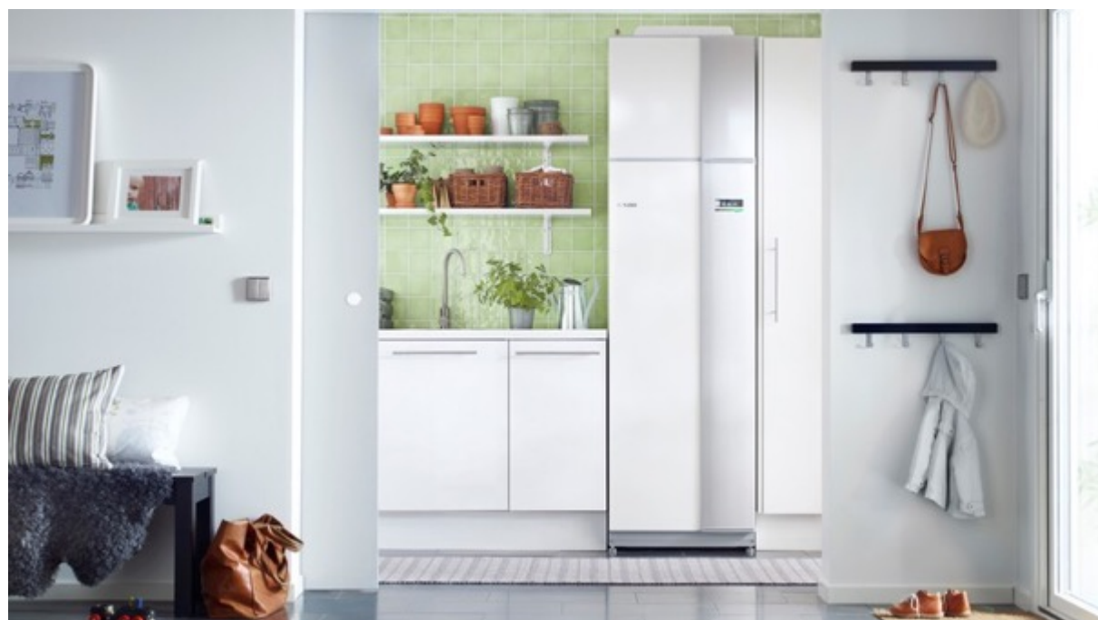
Ventilační tepelné čerpadlo NIBE F730

Tepelná čerpadla jako vysoce účinné zdroje tepla mají nižší spotřebu elektřiny a snižují tak uhlíkovou stopu rodinných domů, bytových domů i firem.