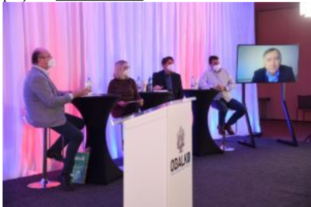
Panelová diskuse: Recyklace bez obalu!

Obalový trh ale nebude muset čekat do října, aby získal prostřednictvím projektu OBALKO další inspiraci a informace. Pořadatelská skupina ATOZ Packaging chystá inovace projektu, které promění OBALKO v celoroční projekt. Další pokračování přijde už v březnu v podobě rozsáhlé tištěné a elektronické publikace Ozvěny Obalka. Pokud chcete sledovat další vývoj projektu OBALKO, můžete se registrovat pro emailové zpravodajství projektu na www.atozregistrace.cz/obalko anebo sledovat webové stránky projektu www.obalko.cz .