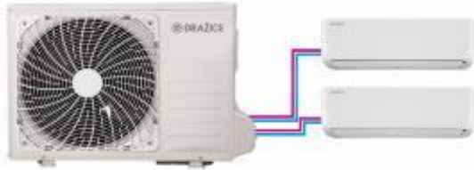
Venkovní jednotka s dvěma vnitřními (klimatizace AIR typu multisplit)

K chlazení domácnosti můžete využít jak klimatizaci, tak tepelné čerpadlo, protože obě zařízení fungují (z fyzikálního hlediska) na stejném principu. Pokud se rozhodujete, které z nich si pořídíte, musíte se zamyslet nad tím, jaký hlavní zdroj energie využíváte, jaké další funkce by měl vámi zvolený produkt splňovat, případně jaké jsou prostorové dispozice vašeho bytu nebo rodinného domu. Tu základní funkci však mají moderní varianty obou zařízení stejnou: dokážou vás ochladit i ohřát.