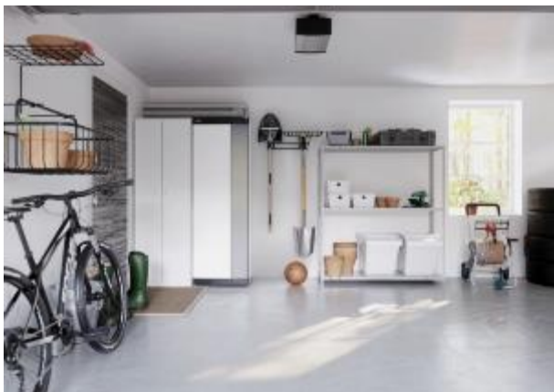
Tepelné čerpadlo NIBE S1255 PC systému země-voda (pasivním chlazení)