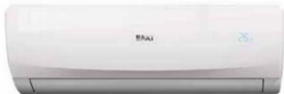
Klimatizační jednotka Luna Clima (Baxi), mono/dual provedení, automatický noční režim, chlazení/topení, cena na dotaz, www.koupelny-ptacek.cz