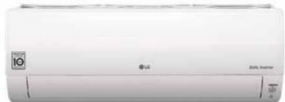
Klimatizační jednotka Deluxe (LG), invertorový kompresor, tichá, ovládání přes telefon, cena 43 197 Kč , www.lg.cz