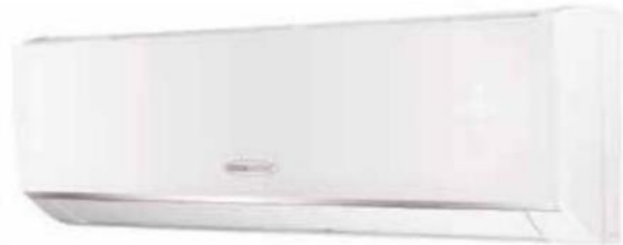
Dělená klimatizace Coolexpert ACH-09BI chladí, topí, odvlhčuje a ventiluje, cena včetně venkovní jednotky 11 950 Kč , www.hornbach.cz

Klimatizace lze jednoduše rozdělit na mobilní a stacionární. Mobilní jednotky můžete volně přesouvat z místnosti do místnosti, ale teplo z nich je nutné odvádět ohebnou hadicí skrz okno nebo pootevřenými dveřmi. Mobilní jednotky jsou vzhledem k vyšší spotřebě a hlučnosti vhodné pro občasné využití. Pokud uvažujete o pořízení klimatizace do celoročně či pravidelně užívaného obydlí, zaměřte se na stacionární jednotky. Tyto pevně zabudované jednotky najdete opět v několika provedeních. Splitová klimatizace se skládá z vnitřní a venkovní části, které jsou mezi sebou propojeny Cu potrubím a komunikační kabeláží. Vnitřní jednotka obsahuje ventilátor, výparník a řídicí elektroniku. Ve venkovní jednotce najdete kompresor, expanzní ventil, kondenzátor a řídicí elektroniku. Multisplitová klimatizace je prakticky totožná s klimatizací splitovou, pouze s tím rozdílem, že vnitřních jednotek může být více. V současné době je možné na jednu venkovní jednotku připojit až pět vnitřních přímo, to znamená, že od venkovní jednotky jde samostatná trasa pro každou vnitřní jednotku. Není to tedy systém páteřního vedení s odbočkami. Z mnoha možností volitelných funkcí, které klimatizace nabízejí, bychom neměli opomenout ani systémy inteligentního řízení na základě snímání aktuální teploty v místnosti nebo slunečního jasu. V tomto případě čidlo slunečního záření sleduje změny intenzity slunečního světla a výhodnouje aktuální požadovaný výkon klimatizace.