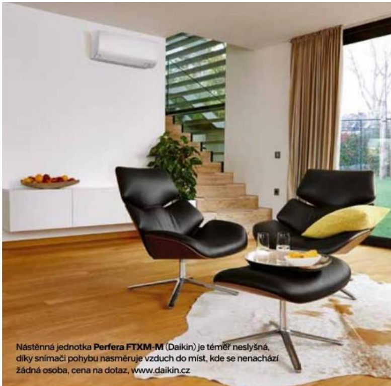
Nástěnná jednotka Perfera FTXM-M (Daikin) je téměř neslyšná, díky snímači pohybu nasměruje vzduch do míst, kde se nenachází žádná osoba, cena na dotaz, www.daikin.cz