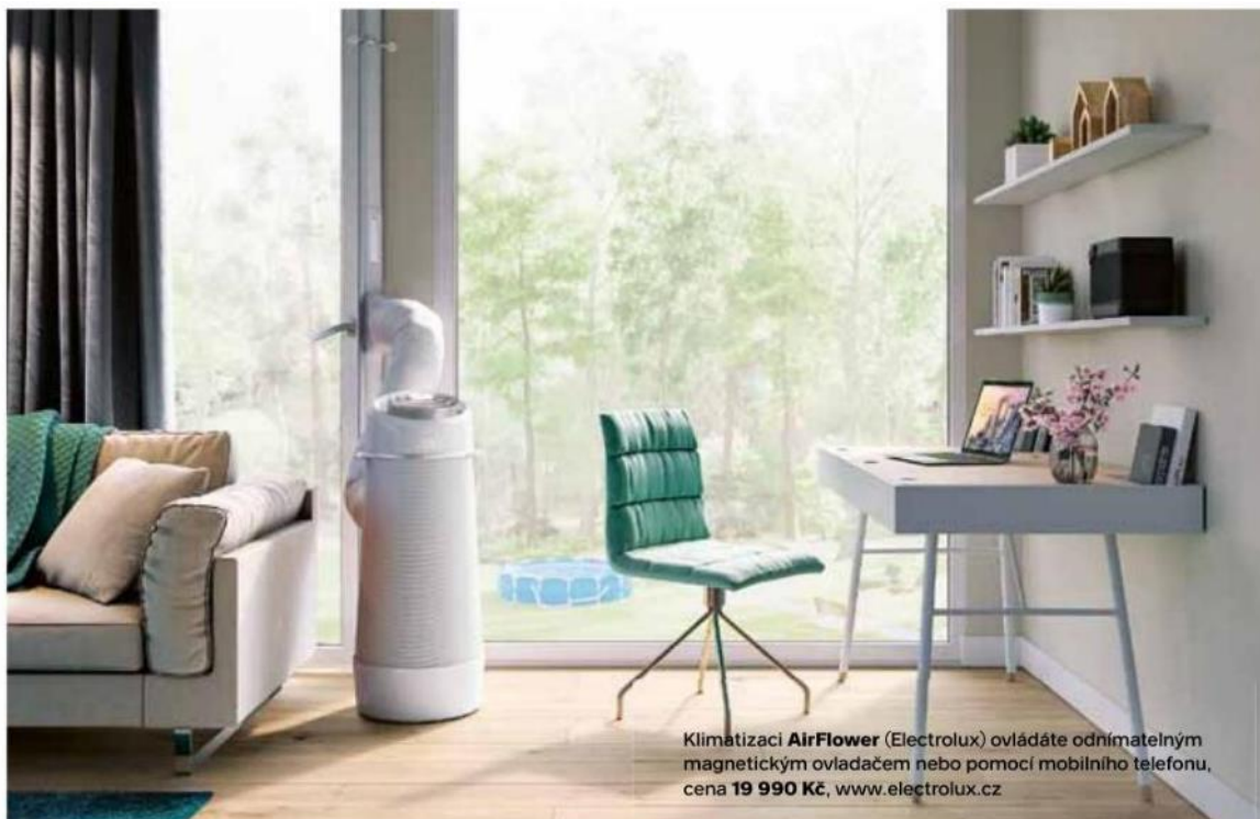
Klimatizaci AirFlower (Electrolux) ovládáte odnímatelným magnetickým ovladačem nebo pomocí mobilního telefonu, cena 19 990 Kč , www.electrolux.cz