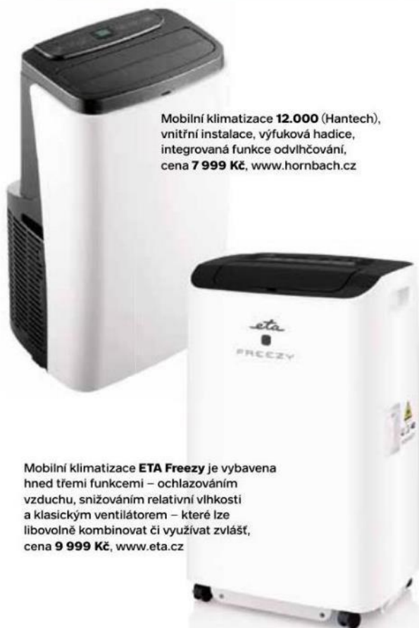
Mobilní klimatizace 12.000 (Hantech), vnitřní instalace, výfuková hadice, integrovaná funkce odvlhčování, cena 7 999 Kč , www.hornbach.cz